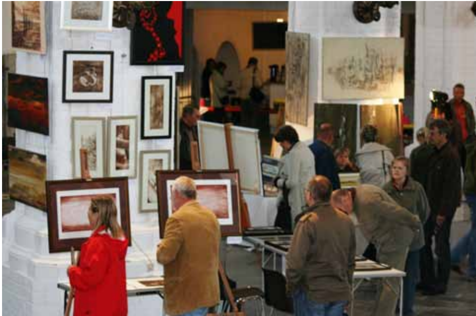
In der Nikolaikirche